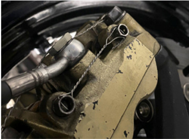
Borgen borgpennen remblokken