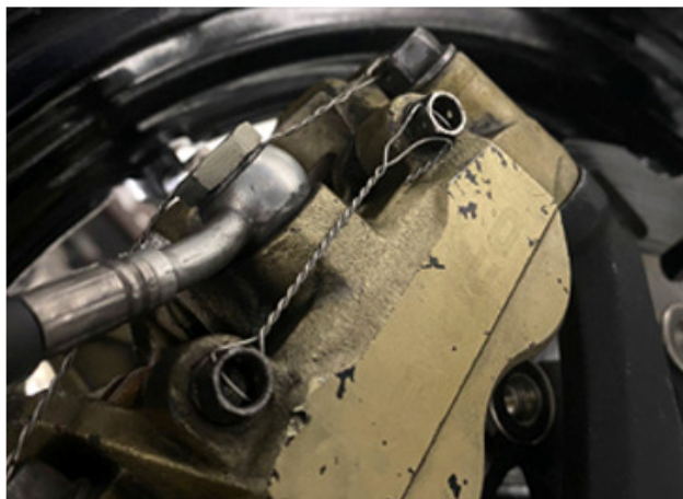
Borgen borgpennen remblokken